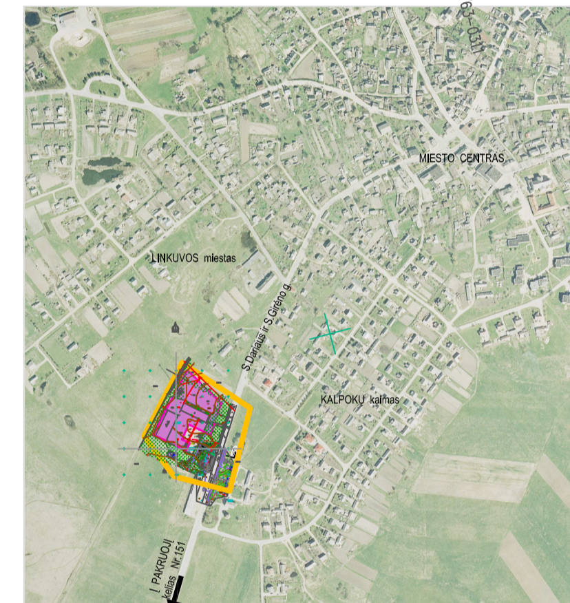
VIETOVĖS SCHEMA M 1:10 000

PASTABOS: * ŠIS DETALUSIS TERITORIJOS PLANAVIMO PROJEKTAS PARĖNGTAS REMONTINĖS VIETOVOS RESPUBLIKOS TERITORIJŲ PLANAVIMO (STATYMO PAKETIMO) STATYMATŲ (2004 01 15), LIETUVOS RESPUBLIKOS VYKIAUSIŠĖS 1992 05 12 NUTARIMU NR.343 SPECIALIOSIOS ŽEMĖS IR MŠKO NAUDOJIMO SĄLYGOS* BEI PAKRUOJIO RAJONO SAVIVALDYBĖS ADMINISTRACIJOS DIREKTORIAUS PATVIRTINTŲ PLANAVIMO SĄLYGŲ SAVADU. ** PROJEKTAS ATITINKA GALIOJANČIUS EKOLOGINIUS, HIGIENINIUS, PRIEŠGAISRIŲ REKALAVIMUS TERITORIJŲ PLANAVIMUIR INSTITUCIJOMS BEI PATVIRTINTAS Miesto SAVIVALDYBĖJE. *** PROJEKTINIUS SPRENDINIUS GALIMA KEISTI TIKTAI SUDERINUS SU PLANAVIMO SĄLYGAS IŠDAVUSIOMIS TARNYBOMIS. **** ŽEMĖS KASINĖJAMO DARBUS SKLYPE GALIMA ATLIKTI PRIEŠ TAI APŪJE JUOS PRANESUS POŽEMINIUS TINKLUS PRIDŪRINČIOMIS TARNYBOMIS. ARCH. J. RŪKIENĖ, ATEST. NR. A1002/2008