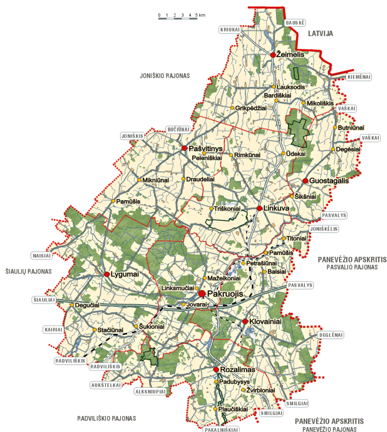
1 pav. Pakruojo rajono teritorija

Žemės ūkis - pagrindinė rajono ūkinės veiklos sritis. Rajone yra 15 žemės ūkio bendrovių ir 1463 ūkininkai.